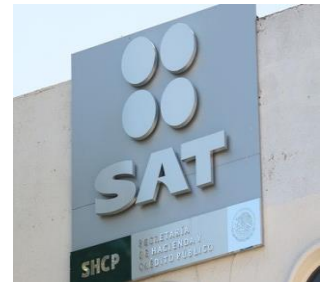
El SAT complica la devolución cuando requiere información que está fuera del alcance de las personas que la solicitan