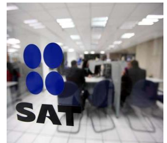
"Después de todo fue poco tiempo, todo esto surge en diciembre del año pasado, fueron tres meses que resultaron pocos para poder informar a todos los contribuyentes y que los propios proveedores nos adaptáramos", dijo