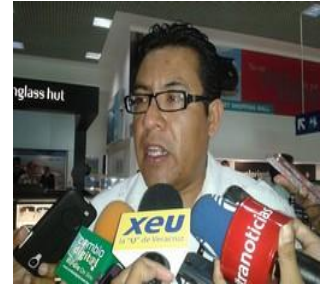
El 30 de abril vence el plazo para presentar la declaración anual.