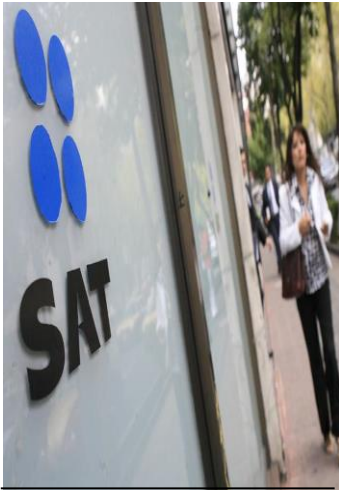
Especialistas cuestionan la seguridad cibernética en México