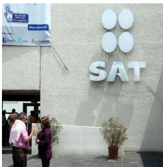
La SHCP publica en el DOF facilidades administrativas http://eleconomista.com.mx/sistema-financiero/2014/12/30/shcp-publica-dof-facilidades-administrativas