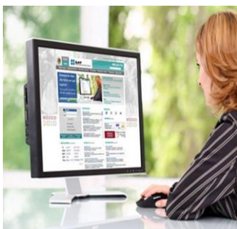
Facilidades administrativas para los contribuyentes en 2015 http://www.dineroenimage.com/2014-12-30/48557

como del resto de los petrolíferos, difícilmente contribuirán a mejorar las finanzas de Pemex, entidad que todavía tendrá la responsabilidad de producir y comercializar estos combustibles. La filial Pemex Refinación, encargada de transformar el petróleo crudo en derivados y comercializarlo en el país, prevé que las ventas internas de petrolíferos en 2015, entre los que se incluyen gasolinas, diesel, turbosina, combustóleo, asfaltos, querosenos, grasas, lubricantes, naftas, gasóleo y combustible industrial, entre los más importantes, le permitirán ingresos totales por 620 mil 295 millones de pesos (ya incluido el efecto de aumento de precios). Fuente: El Universal